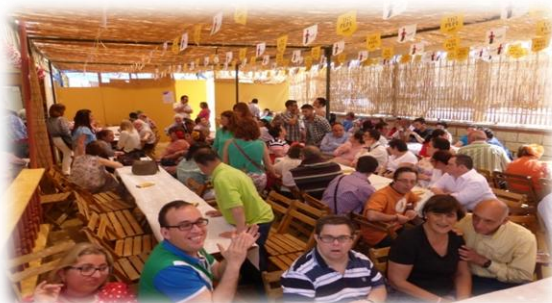
FERIA DEL CABALLO 2016