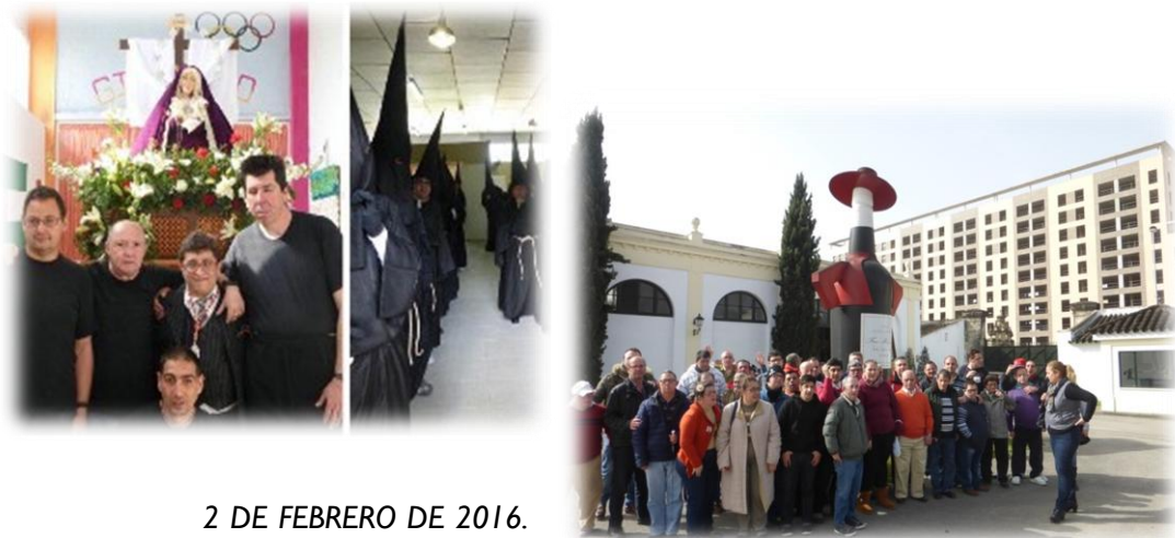
2 DE FEBRERO DE 2016. VISITA A LA BODEGA GONZÁLEZ BYASS

21 MARZO 2016 UN VIERNES DIFERENTE, UN VIERNES CON SABOR COGRADE